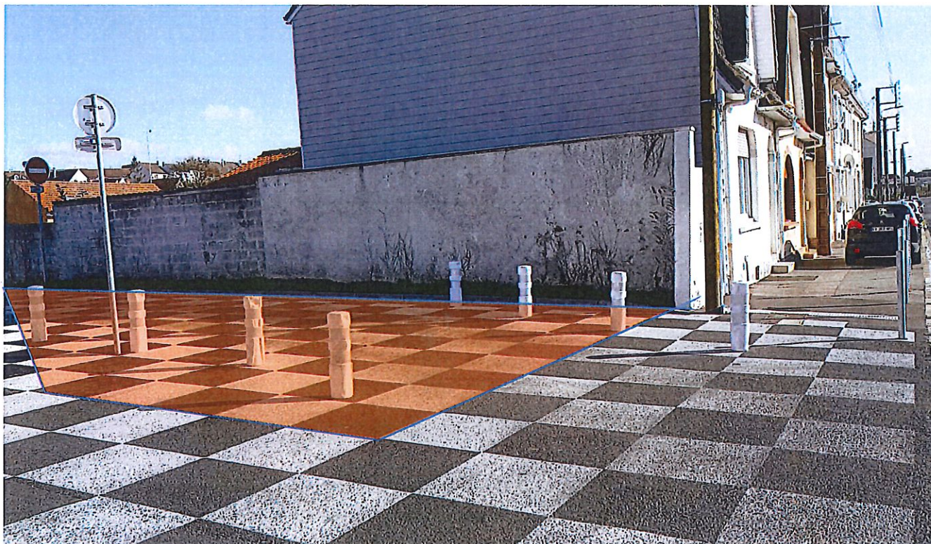
Situation approximative de la parcelle AE 286