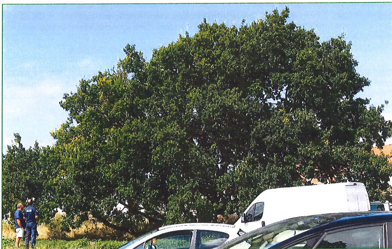
Le premier arbre remarquable labellisé sur la commune en 2018, un chêne de plus de 300 ans.

Parallèlement la commune engagera une réflexion sur une potentielle adhésion à la Charte européenne de l'arbre initiée en 1995.